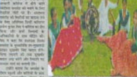
ਦੁੱਖੀਸੀ ਨੇ ਲਿਖਾ ਤਿਆਰੀਆਂ ਕਰਾ ਜਾਬਯਾ