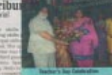
ਸ਼ਿਕਸਾ ਸਾਹਿਬ ਦਿਲਾਵੇ ਸ਼ਕੂਲਾਂ 'ਚ ਮਿਹਰੀ

CHANDIGARH Tribune ਸ਼ਿਕਸਾ ਸਾਹਿਬ ਦਿਲਾਵੇ ਸ਼ਕੂਲਾਂ 'ਚ ਮਿਹਰੀ