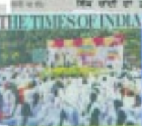
ਸੋਨਲ ਪਧਰੀ ਖੇਡ ਮੁਕਾਬਲਿਆਂ 'ਚ ਸ਼ੰਤ ਬਾਬਾ ਵਰਿਆਮ ਸਿੰਘ ਮੈਮੋਰੀਅਲ ਪਬਲਿਕ ਸਕੂਲ ਦੇ ਬੱਚਿਆਂ ਦਾ ਚੰਗਾ ਪ੍ਰਦਰਸ਼ਨ