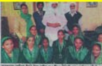
ਸ਼ਿਕਸਾ ਸਾਹਿਬ ਦਿਲਾਵੇ ਸ਼ਕੂਲਾਂ 'ਚ ਮਿਹਰੀ

ਸ਼ਿਕਸਾ ਸਾਹਿਬ ਦਿਲਾਵੇ ਸ਼ਕੂਲਾਂ 'ਚ ਮਿਹਰੀ ਸ਼ਿਕਸਾ ਸਾਹਿਬ ਦਿਲਾਵੇ ਸ਼ਕੂਲਾਂ 'ਚ ਮਿਹਰੀ