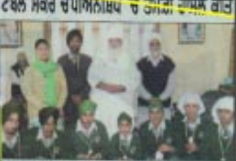
ਟੇਬਲ ਸੋਕਰ ਚੈਂਪੀਅਨਸ਼ਿਪ 'ਚ ਚਾਂਡੀ ਗੜ੍ਹ ਸਕੂਲ